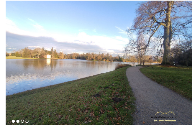
Wörlitzer Park (4) - Kopie