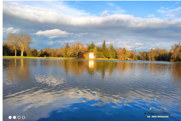
Wörlitzer Park (2) - Kopie