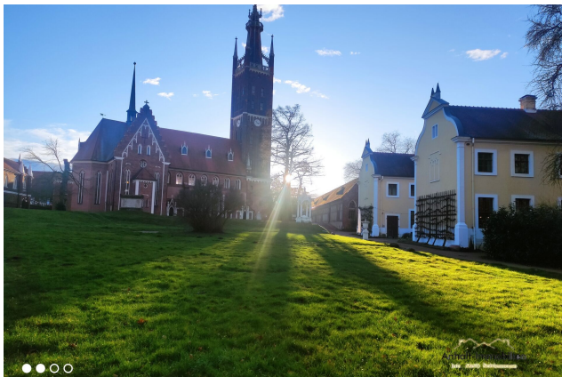
Wörlitzer Park (5) - Kopie