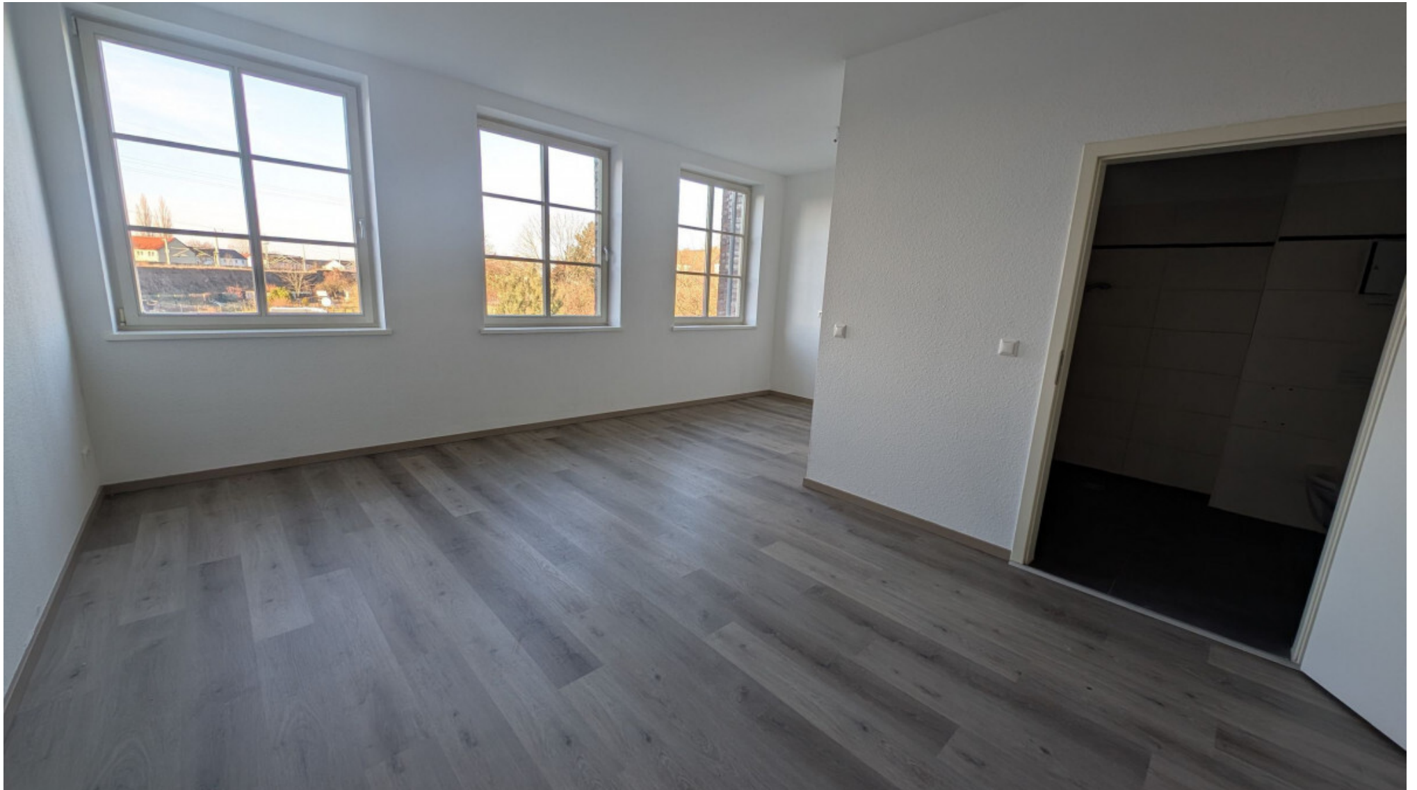
Wohnzimmer, offene Küche