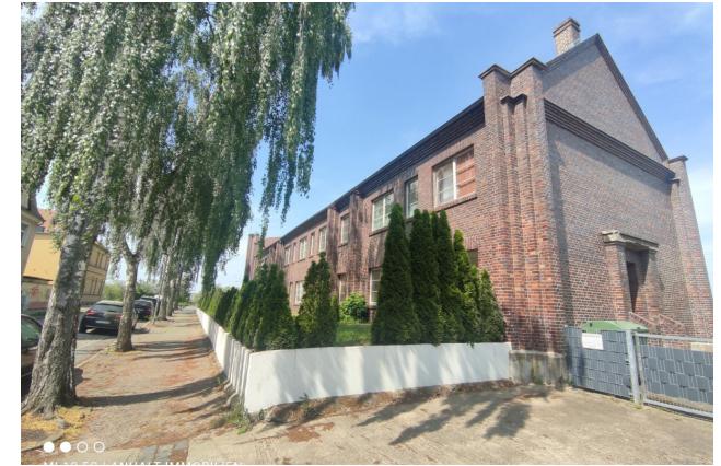
Haus Raguhner Straße