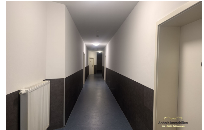
Flurgang zu den Wohnungen