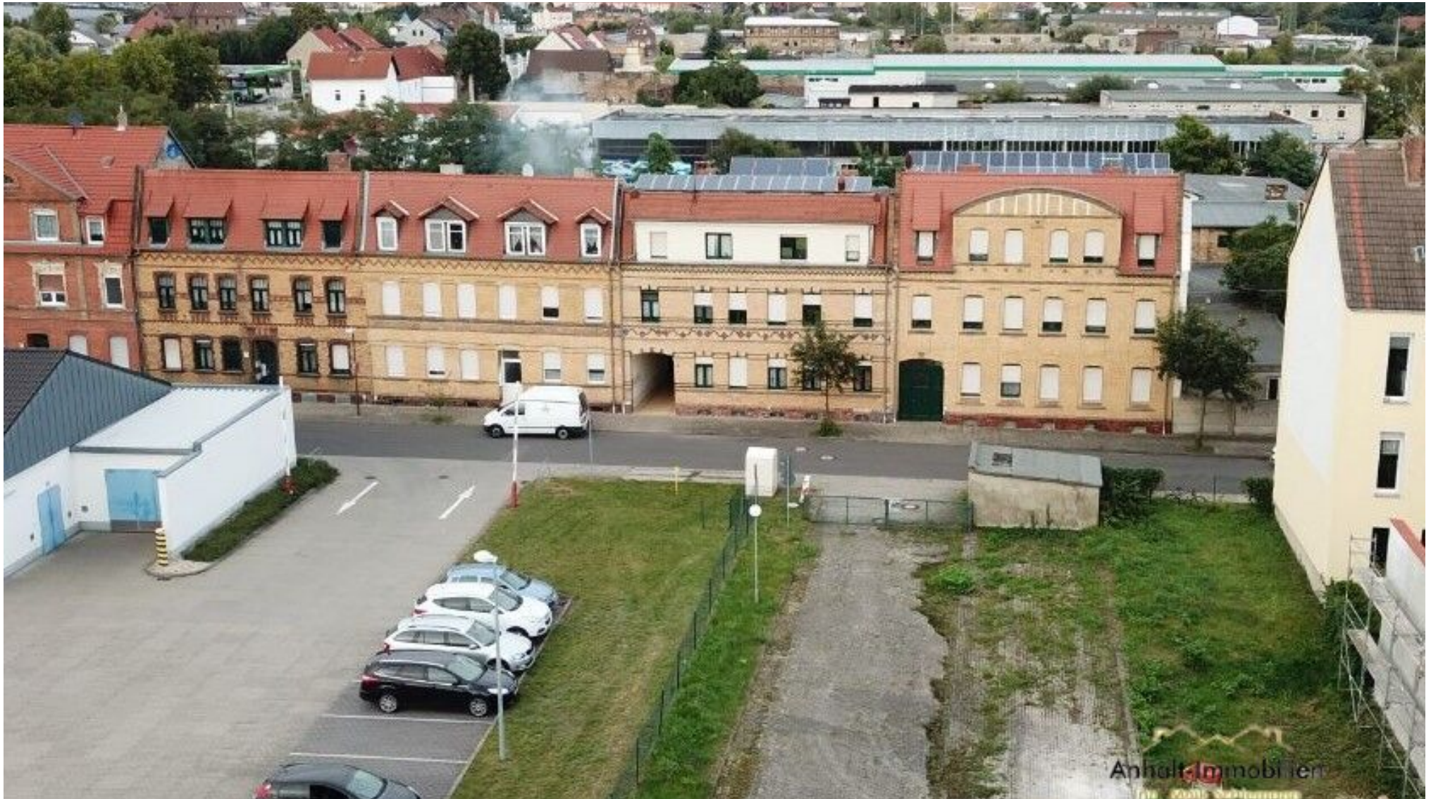
Hausansicht Holzweißiger Str.