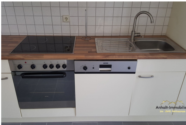
EBK mit Geschirrspüler